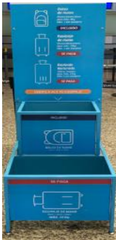
Estructura de Medición